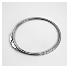
lever lock ring d180