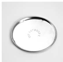
lever lock ring lid d180